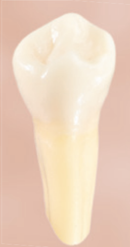
Wurzelbehandelter, toter Zahn